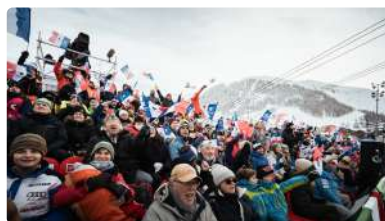
BILLETÉRIE GRAND PUBLIC