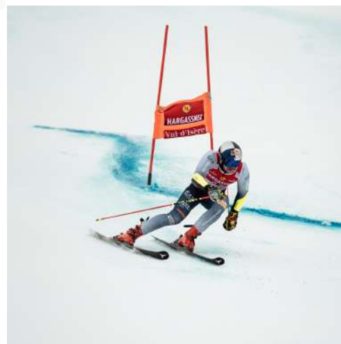
SÉLECTIONS DE PHOTOS 2023