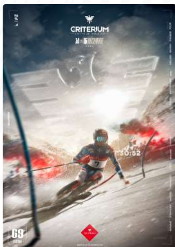
TÉLÉCHARGER L’AFFICHE 2024